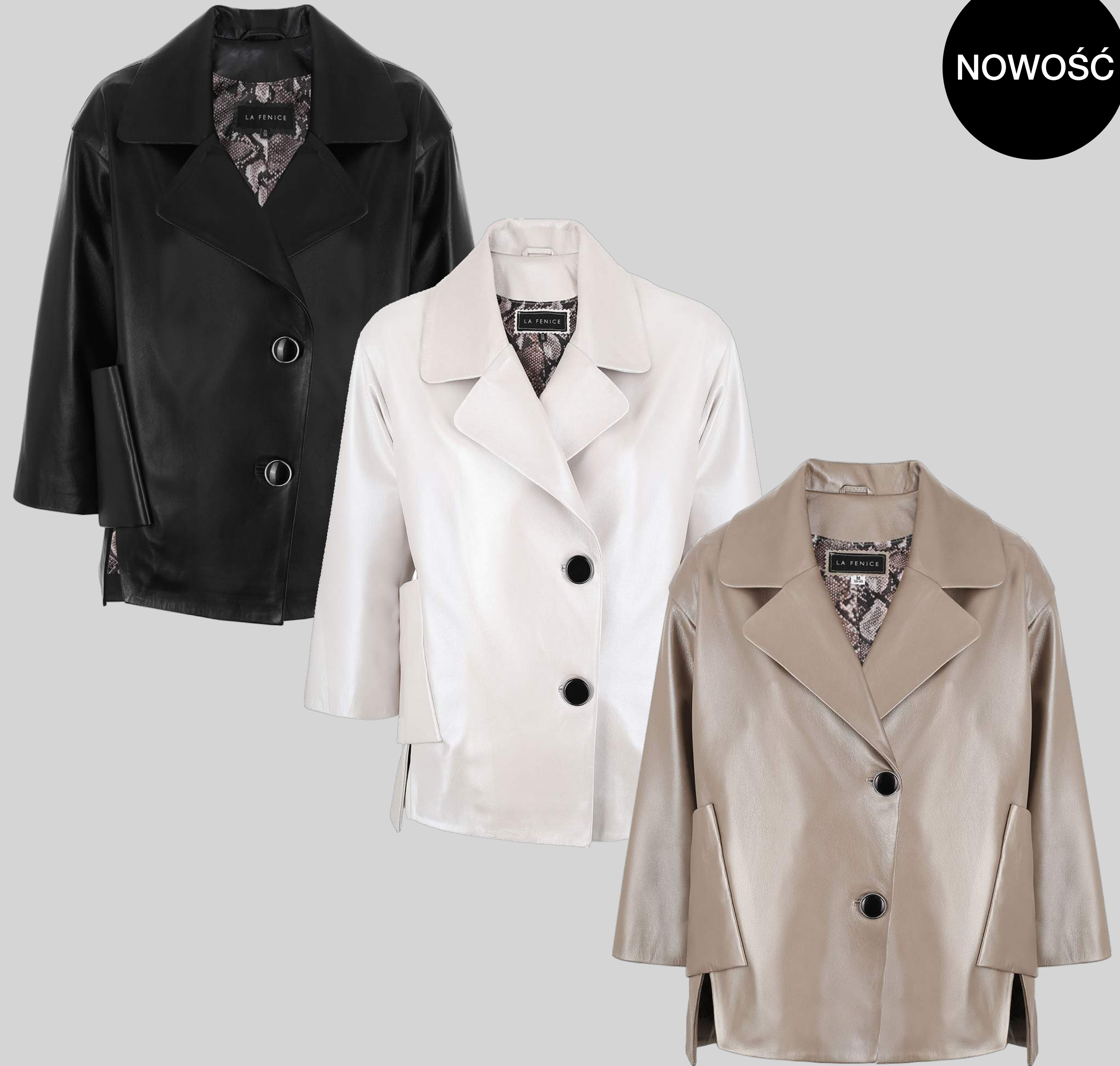
ŻAKIET SKÓRZANY CHRISTINA