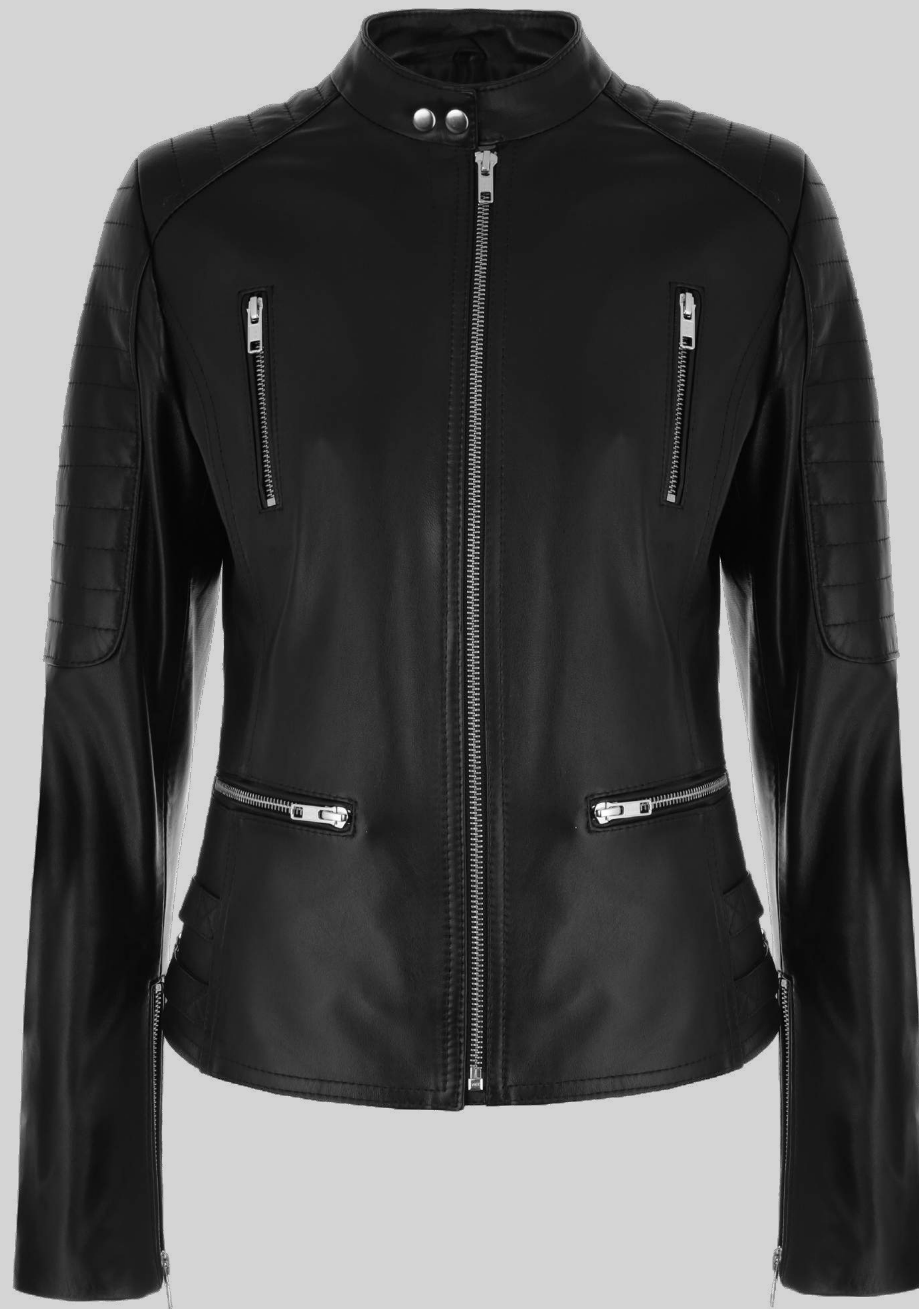
KURTKA SKÓRZANA CHER