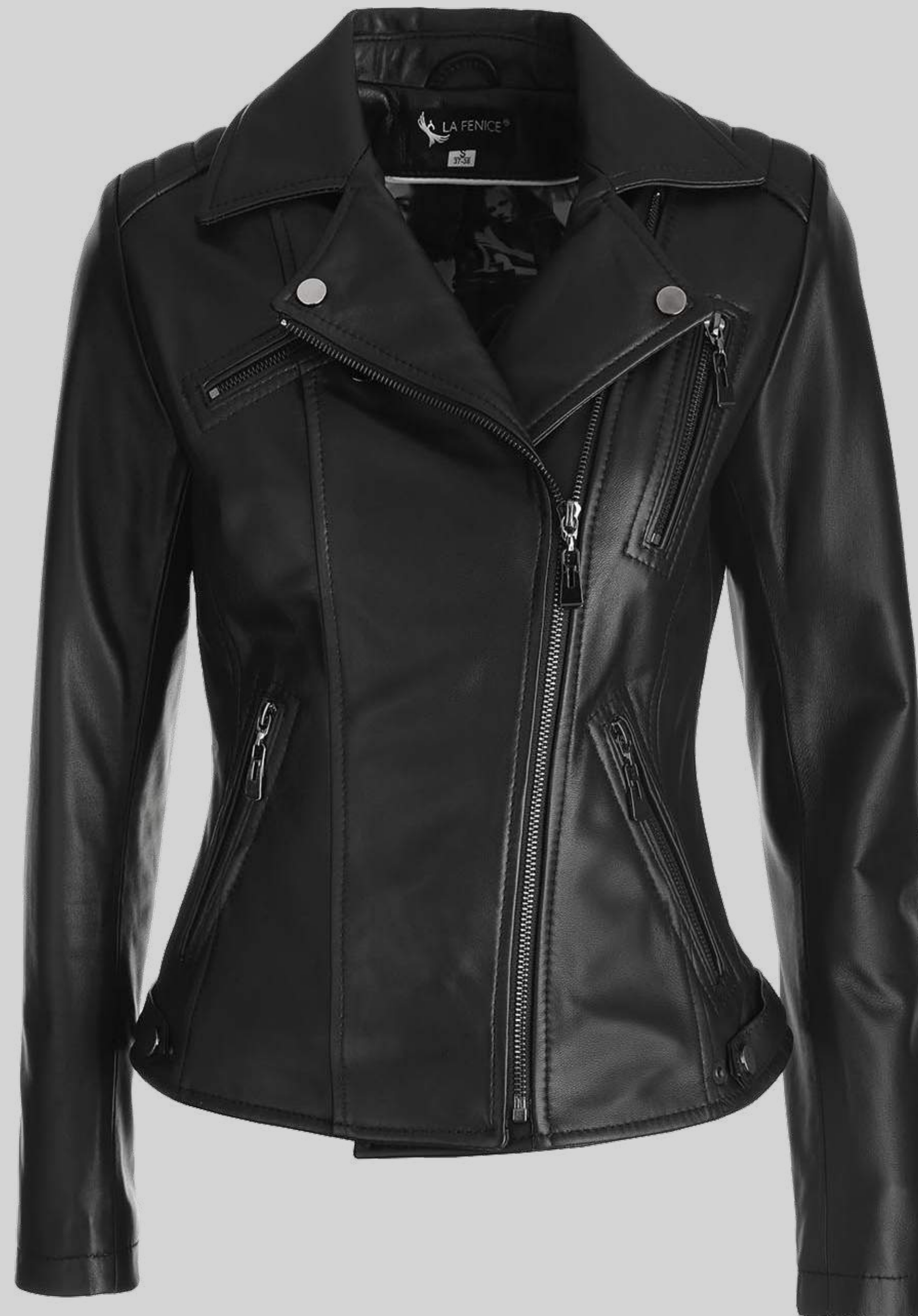
KURTKA SKÓRZANA GRETA B.