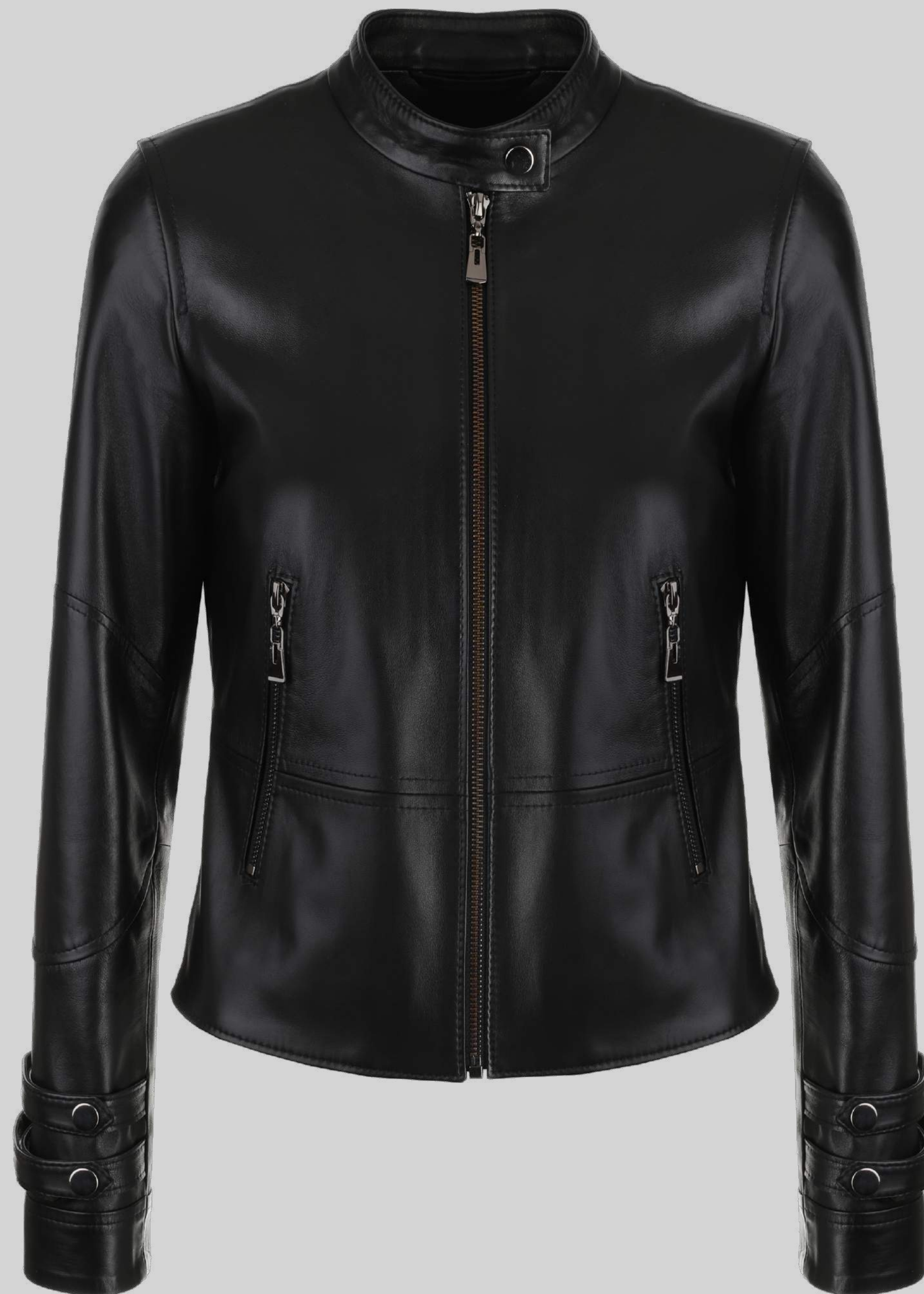
KURTKA SKÓRZANA VIVIEN