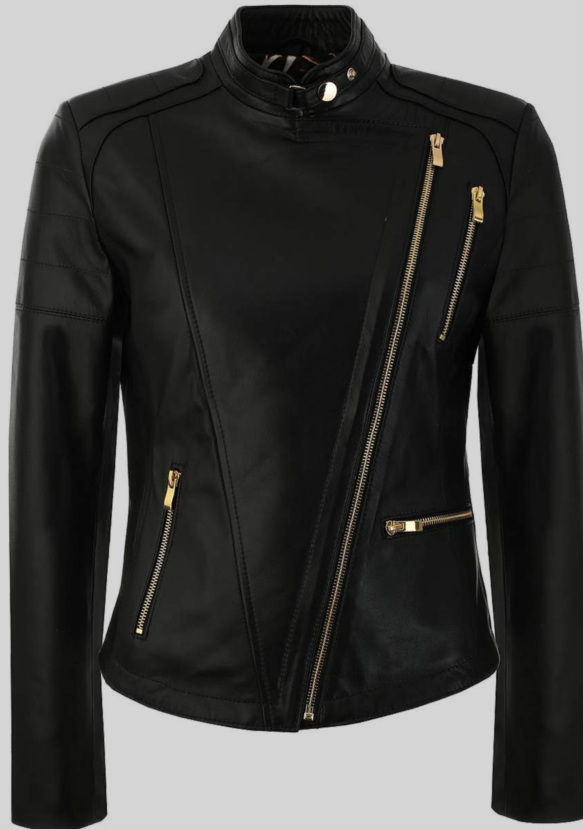
KURTKA SKÓRZANA SHARON