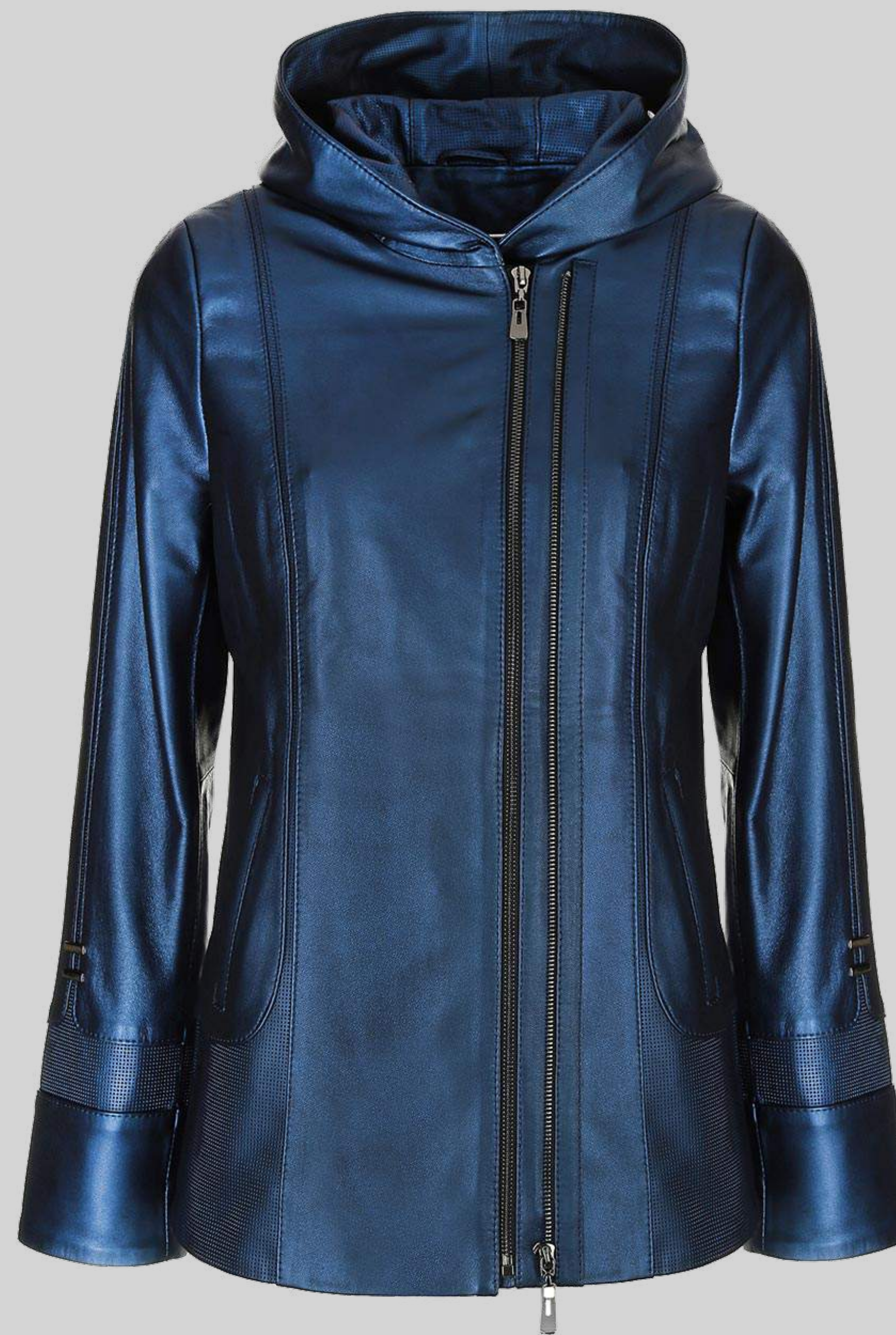
KURTKA SKÓRZANA STELLA