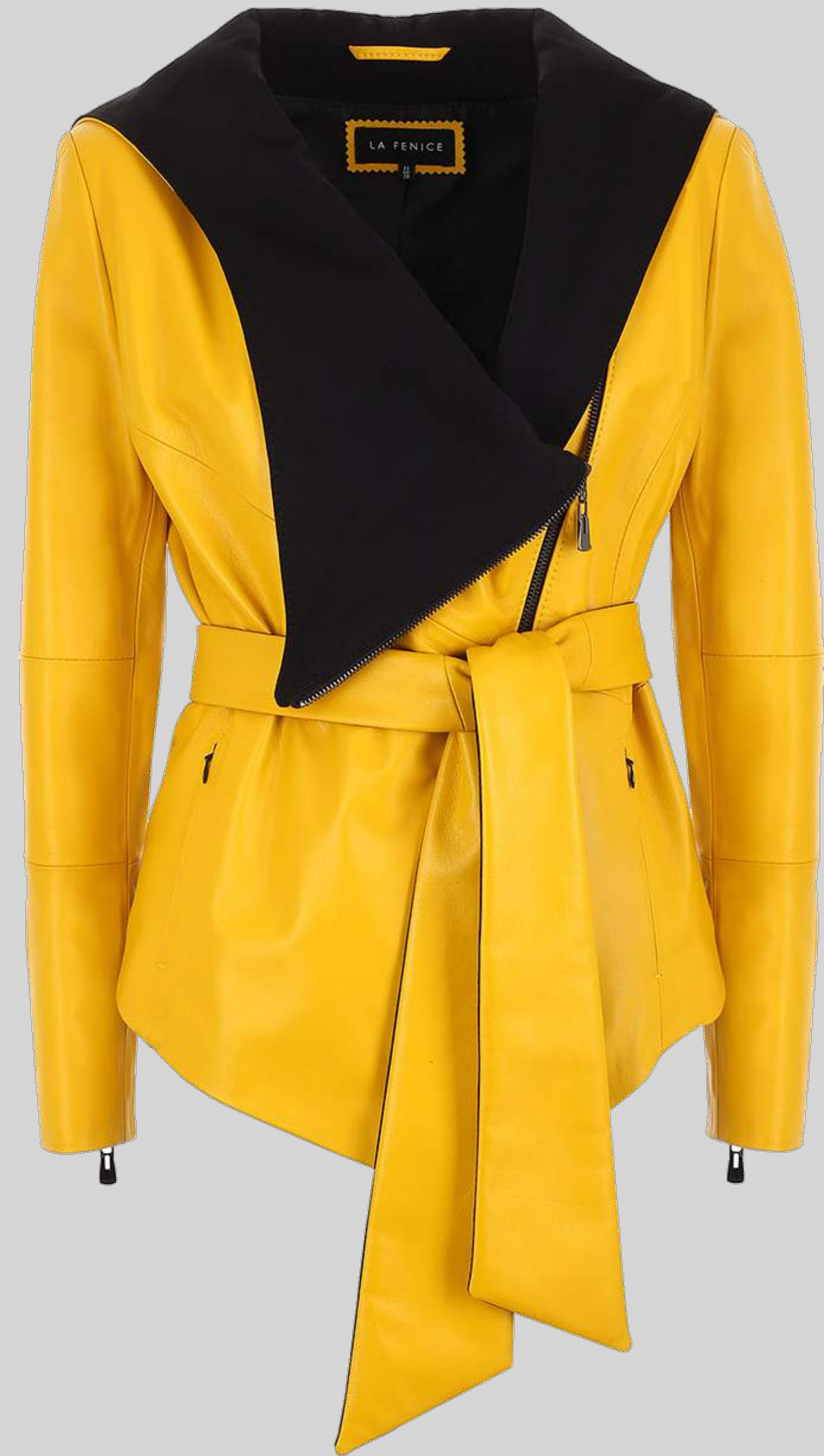
KURTKA SKÓRZANA EMMA