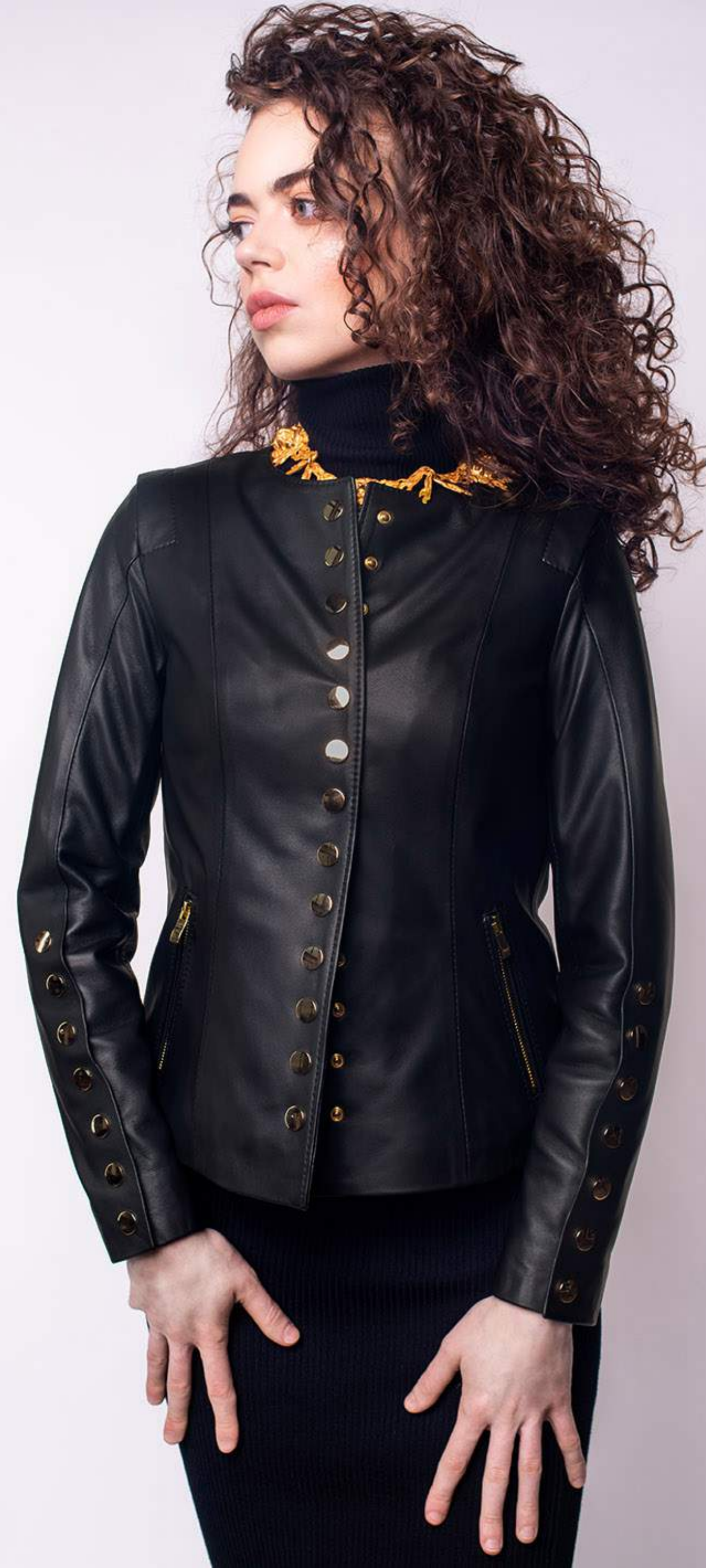
KURTKA SKÓRZANA GRACE