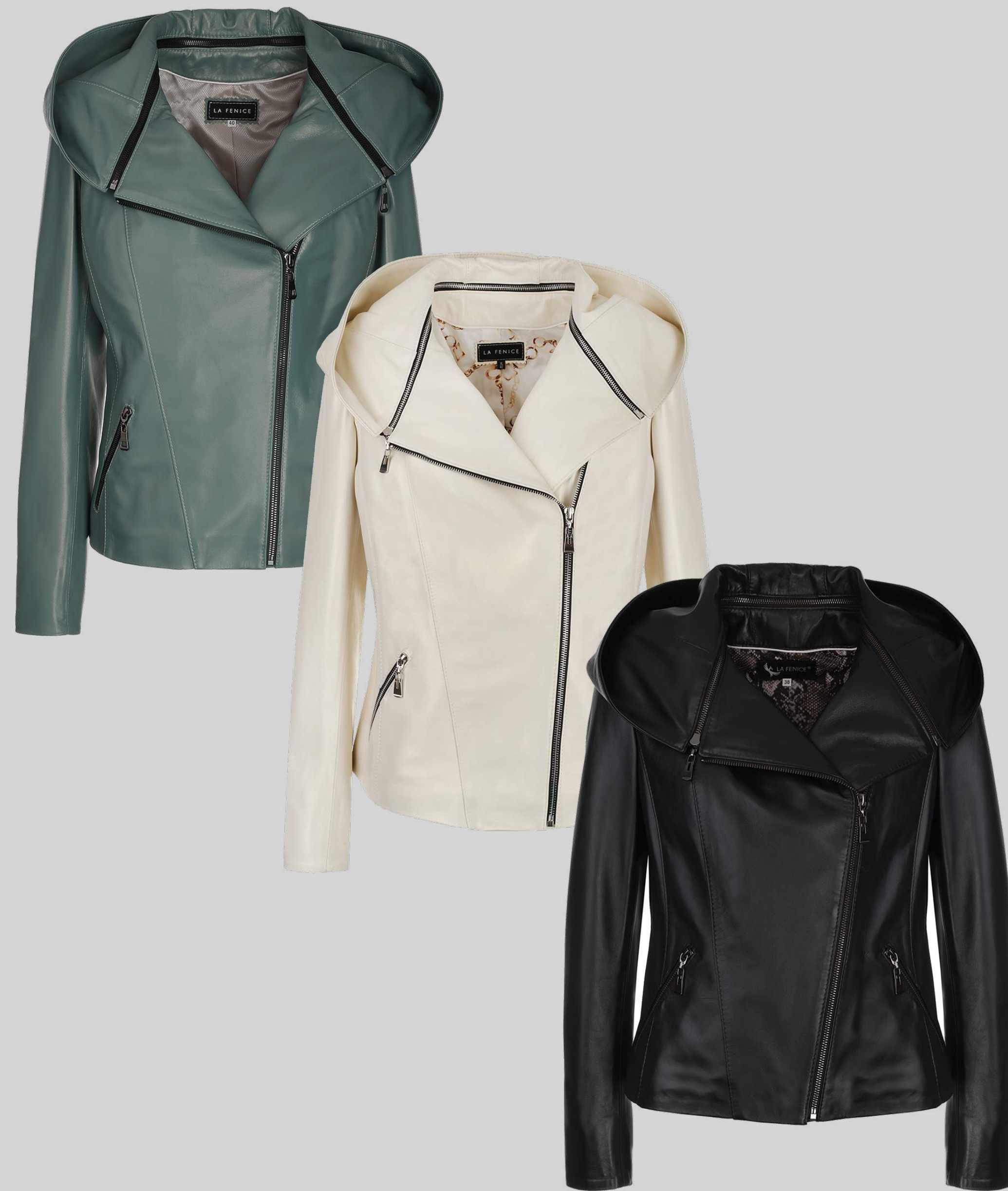
KURTKA SKÓRZANA SAMANTHA