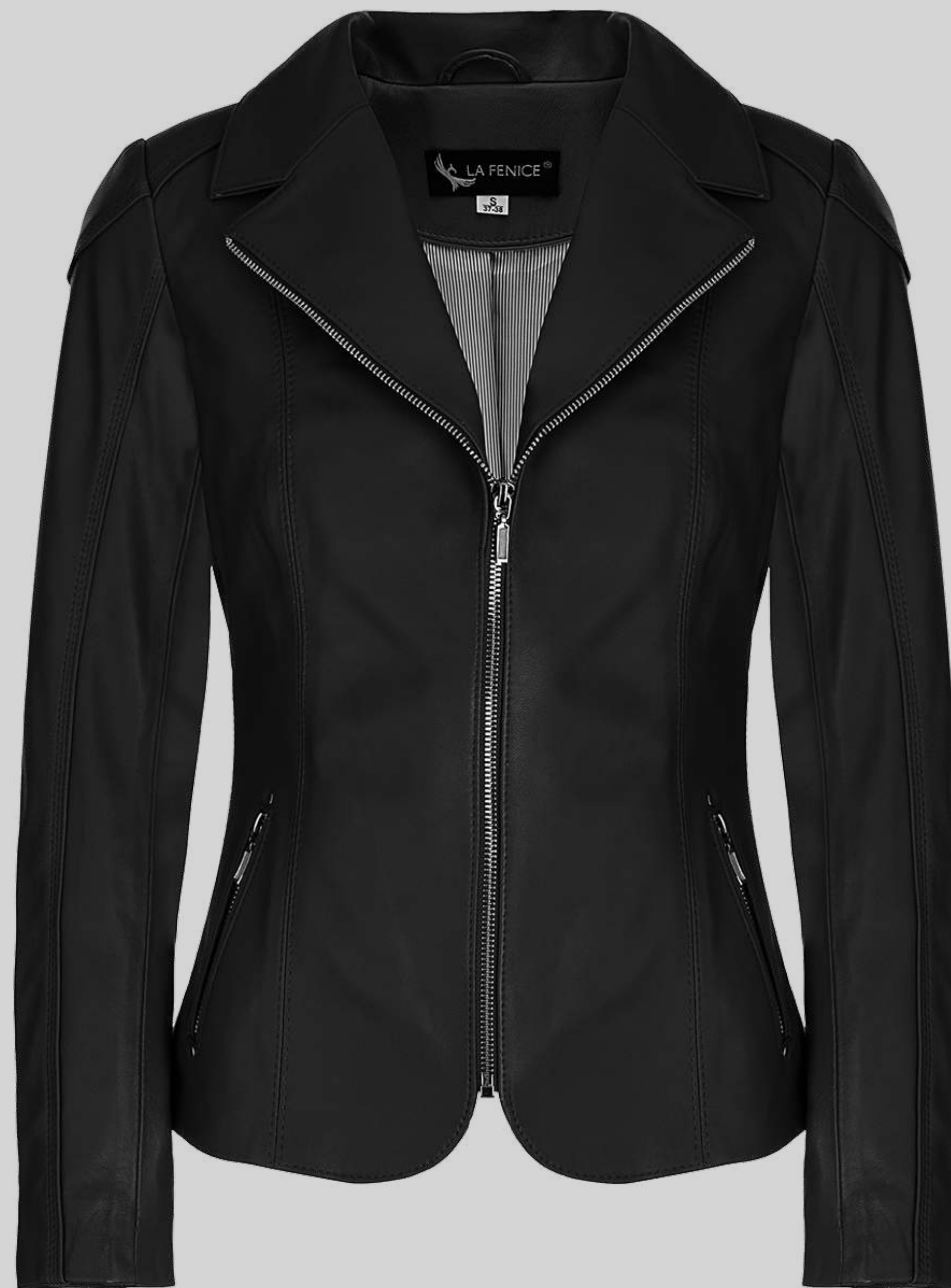
KURTKA SKÓRZANA NELI