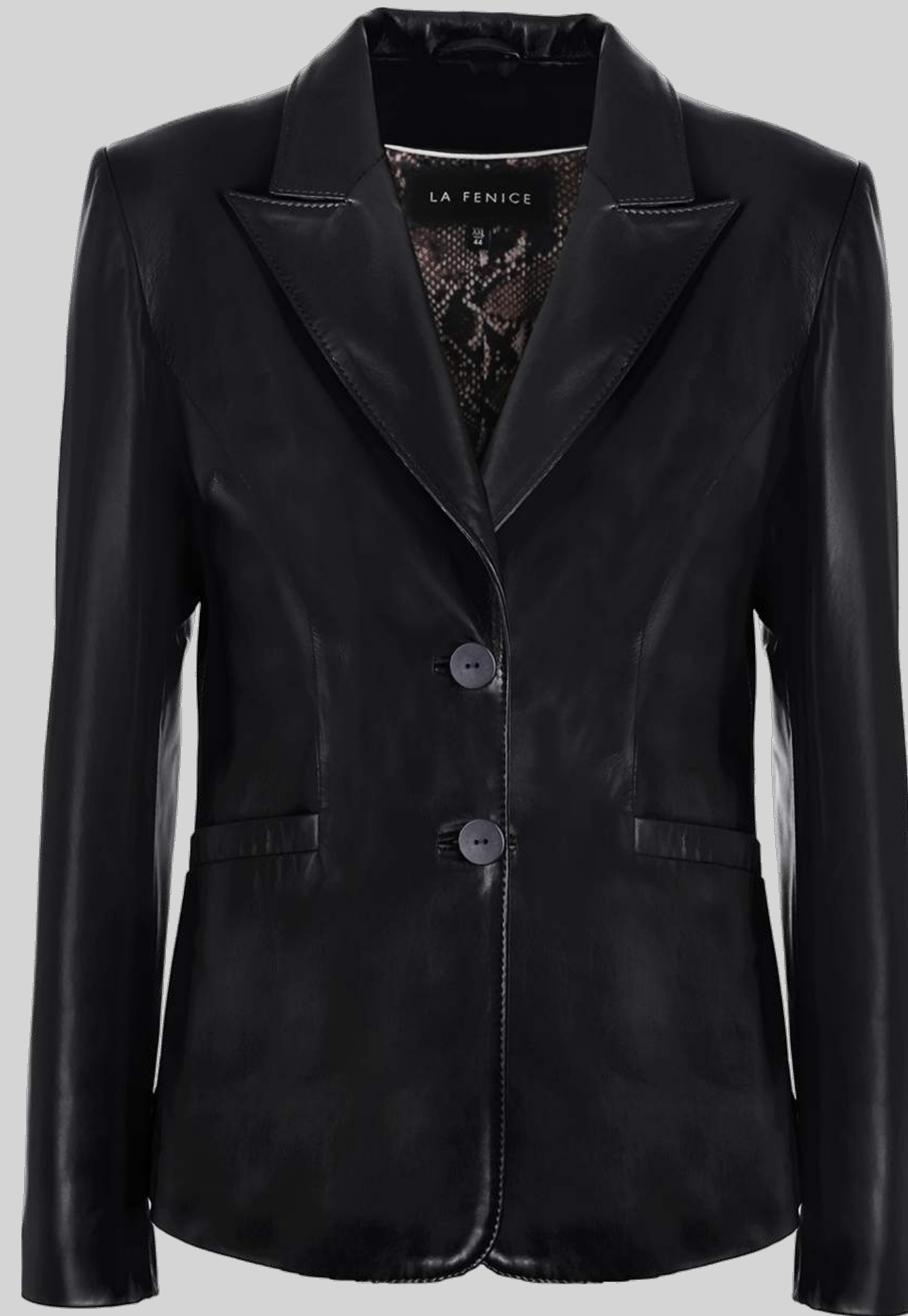
ŻAKIET SKÓRZANY VIOLA